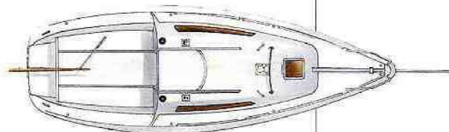
Plan de pont.